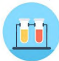
Рисунок 2. Пример игровой наклейки

Личностная мотивация. В течение всей лагерной смены стимулируется личностное развитие и рост каждого ребенка в Центре, с помощью программы Фонда сохранения культурного наследия России» в качестве личной карточки ребенка (Приложение 1). За активное участие в каждом тематическом блоке программы обучающимся будут выдаваться наклейки в виде «Химических колб исследователя» (рис. 1). За каждый пройденный блок, детям ставится печать «Зачтено». В конце смены, после подсчета общего количества печатей у каждого ребенка в зачетной книжке выдается валюта «Лучинки» (Приложение 3). 5 «Лучинок» выдается только на одну печать. Данную валюту дети смогут потратить в конце смены в торговых точках (магазины, салоны). Каждый ребенок сможет не только принять участие в организации торговых точек, но и воспользоваться их услугами, купить на свои деньги «Лучинки» поделки, сделанные детьми или вожатыми в Центре.