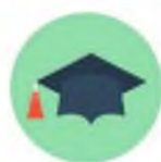
Рисунок 1: Пример игровой наклейки

Отряды, изучившие культурное наследие субъектов РФ получают наклейку «хранителя культурного наследия» по степени значимости: 1 место – планшет», 2 место – «книгу», 3 место – «шапку знатока» (рис. 1). Группа исследователей, прошедшая наибольшее расстояние, награждается за победу в номинации «Лучший отряд смены» и ему вручается кубок смены. Система оценки участия отрядов в общелагерном мероприятии: за 1-е место – 10 баллов; за 2-е место – 5 баллов; за 3-е место – 3 бала. Баллы начисляются не только за участие в мероприятиях, но и за соблюдение режимных моментов всего отряда (таблица 3).